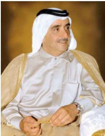
Sheikh Maktoum bin Rashid al Maktoum