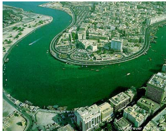
Dubai Creek heute

Bis in die 60er Jahre des 20. Jahrhunderts war Dubai- wie alle arabische Städte am Persischen Golf- eine kleine Siedlung von Halb-Nomaden. Gelegen an einem Meeresarm (Dubai Creek) lebten die Menschen von Perlentaucherei und Fischerei sowie von der Kamelzucht und -handel. Die entscheidenden Wendepunkte markierten zwei Ereignisse: 1963 begann nach der ersten Entdeckung die Förderung von Öl. Zudem entschloß sich 1968 die britische Krone von allen Gebieten östlich des Suez-Kanals zurückzuziehen. Es folgte 1971 die Gründung der Vereinigten Arabischen Emirate (VAE) und finanziert durch die Ölerträge begann eine in der Geschichte der Menschheit vorher nicht gekannte Transformation der ganzen Region vom Mittelalter in die Moderne.