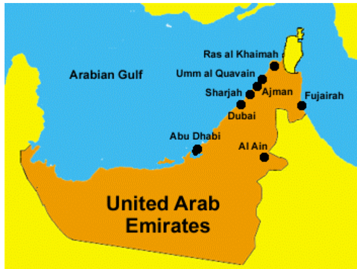
Die Emirate im Überblick

Geschenk nutzten und nutzen Sie heute um in Ihre Zukunft zu investieren.