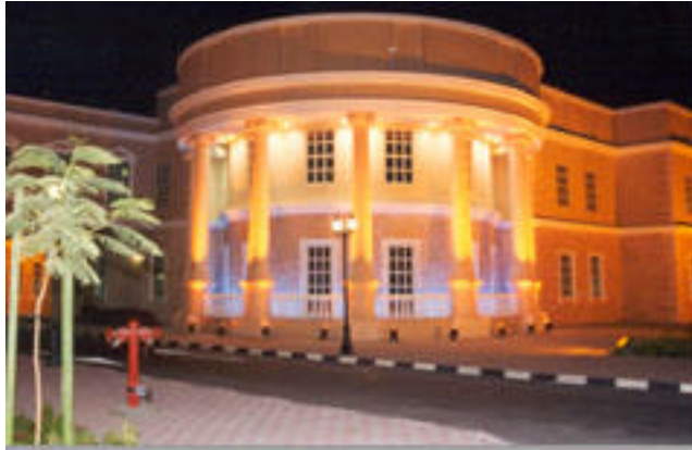
American University Dubai Bereich Business Administration

Die American University Dubai (AUD) ist eine private und noch recht junge Universität. 1995 gegründet, ist die Universität sehr schnell gewachsen und 1999 an den heutigen Standort in Jumeirah Beach, ca. 20km vom „alten Dubai“ entfernt, umgezogen. 52 Professoren und Dozenten lehren auf diesem neuen Campus Business Administration, Information Technology, Visual Communication und Interior Design. Über 1200 Studenten aus über 50 Nationen studieren dort und schaffen ein