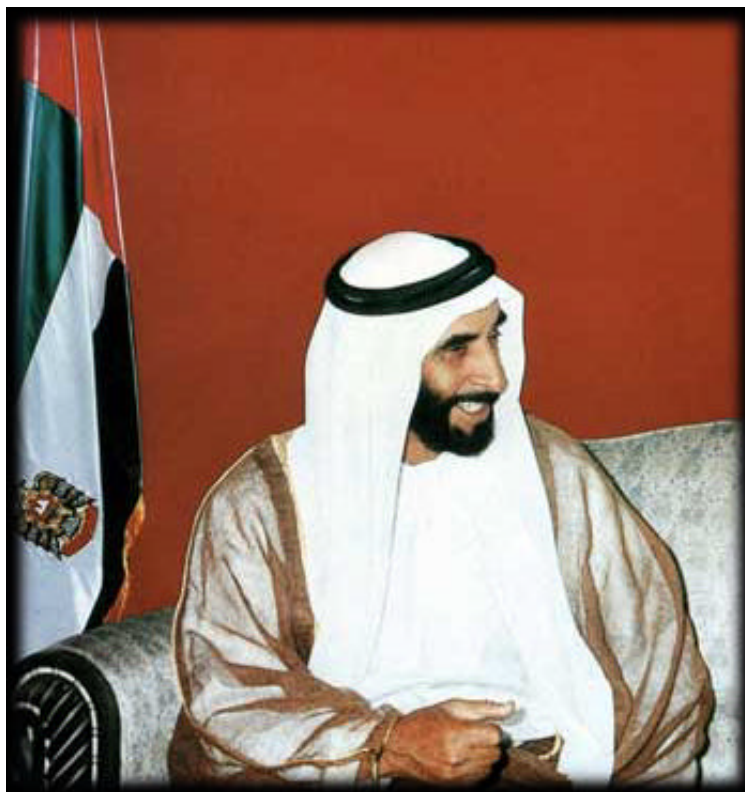
Sheikh Zayed bin Sultan al Nahyan Herrscher der Vereinigten Arabischen Emirate

Dieser Teil meiner Zeit in den Emiraten war sicherlich der aufregendste, jedoch auch der mit Abstand teuerste (Mietwagen!). Mein einziger Rat: Jeder sollte sich seiner Möglichkeiten und Chancen bewusst sein, und sich dann die Kosten und Risiken vor Augen halten (Nach vier Monaten ohne diese Eindrücke zurückzukommen wäre enttäuschend gewesen.)