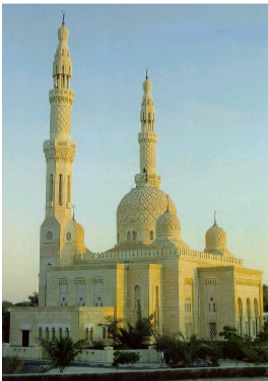
Die Jumairah Moschee unweit von American University Dubai

Die Studenten-Gesellschaft auf dem Campus war noch bunter und ich war sehr froh mit Studenten aus allen Gruppen diskutieren zu können. Überrascht war ich über die Ähnlichkeiten zwischen uns. Selbst viele Mädchen in Hodschab, der traditionellen Gewänder, trugen darunter Jeanshosen und Blusen aus Amerika und Europa. Wir interessierten uns für die gleichen Dinge, schauten die gleichen Filme im Kino, trugen die gleiche Kleidung oder aßen in den gleichen Restaurants.