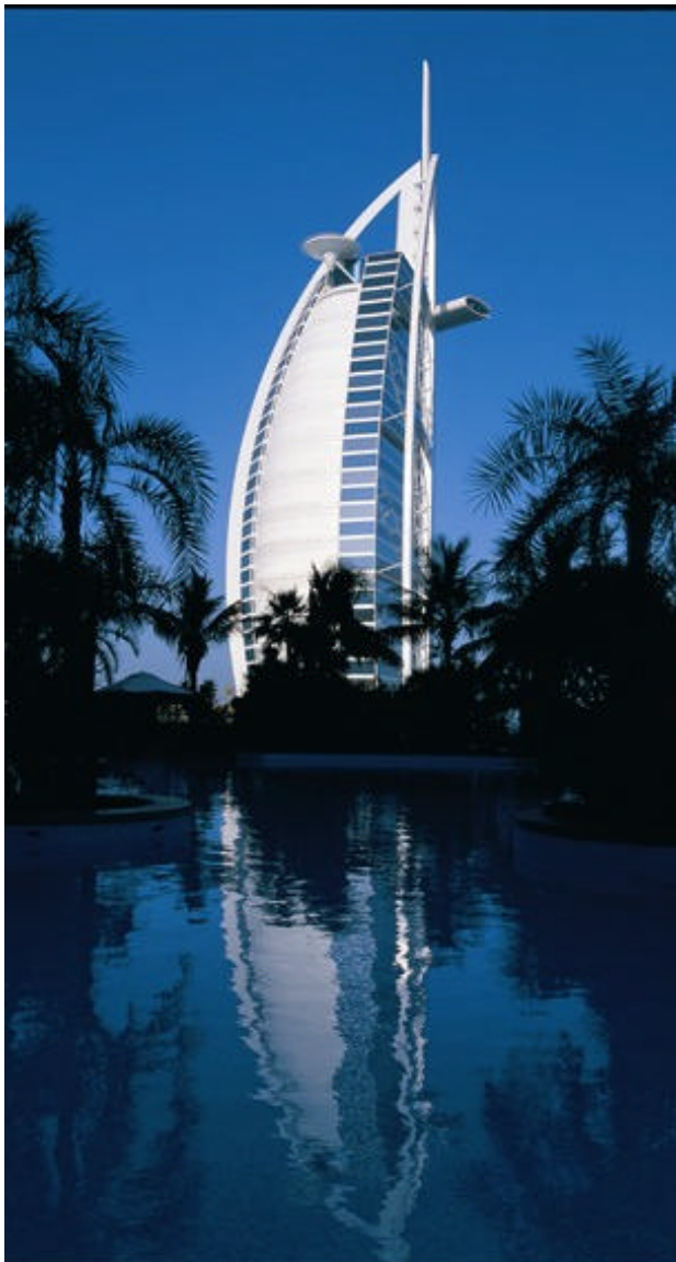
Burj Al Arab

In dieser Atmosphäre zwischen Scheichs und Burj al Arab, Indischen Rockern und Dubai Internet City lebt man, wenn man in Dubai studiert.